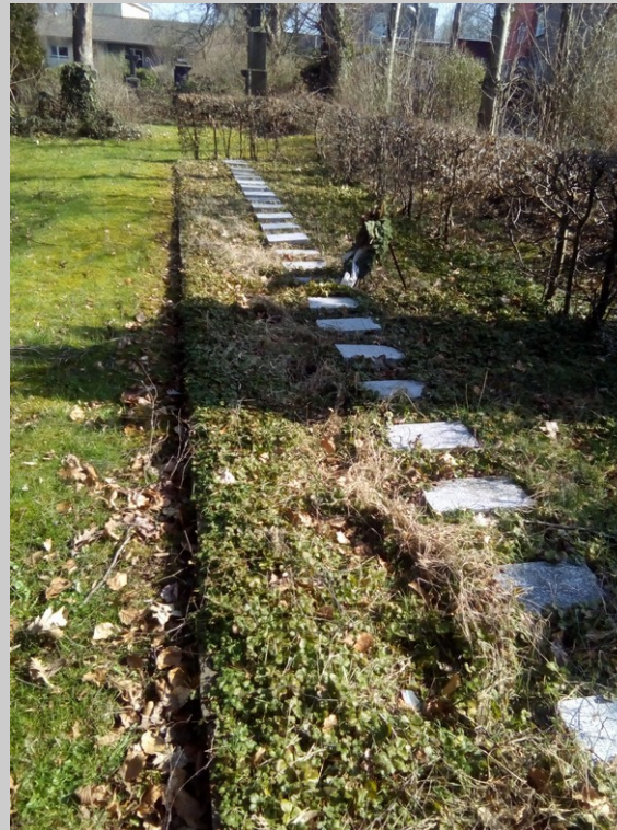
13 Uhr Wipperfürth Don-Bosco-Weg