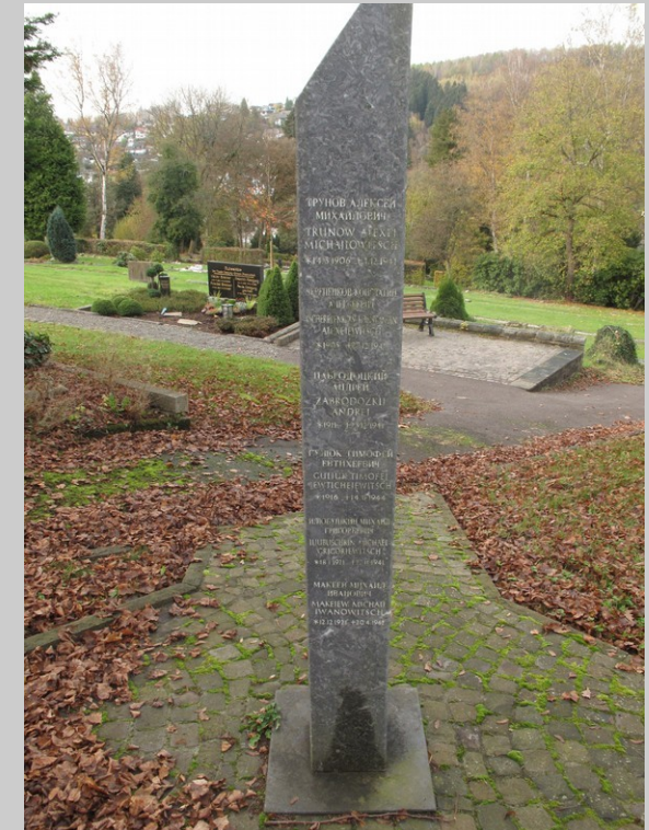
17 Uhr Runderoth Friedhof

Der 22. Juni 1941 hat gezeigt, wohin Rassismus, gepaart mit antisemitischen Verschwörungserzählungen und Nationalismus, führen kann. Wir rufen auf, gemeinsam gegen Rassismus und Antisemitismus, gegen Nationalismus und Feindbilder, für Verständigung und Respekt aufzustehen!